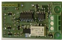
SM102 - larmkort