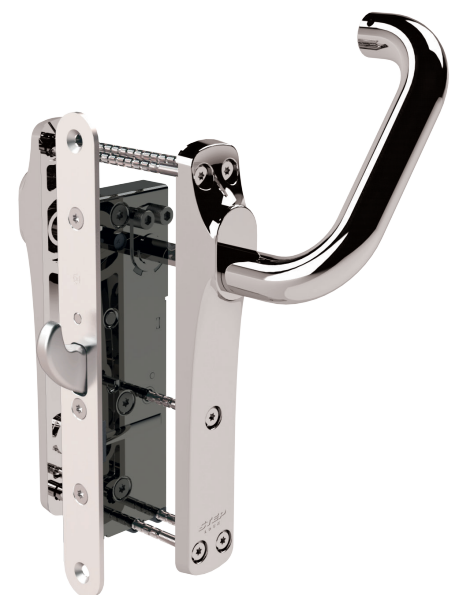
STEP 535 med STEP Exit ST17940-1

STEP 535 är utrustad med FreeDrive®. Den unika tekniken frikopplar motorn och växellådan, vilket innebär att de aldrig påverkas när utrymningsbehörets trycke används. Därmed minimeras påverkan på motor och växellåda – trots att beslaget kanske används tusentals gånger varje dag.